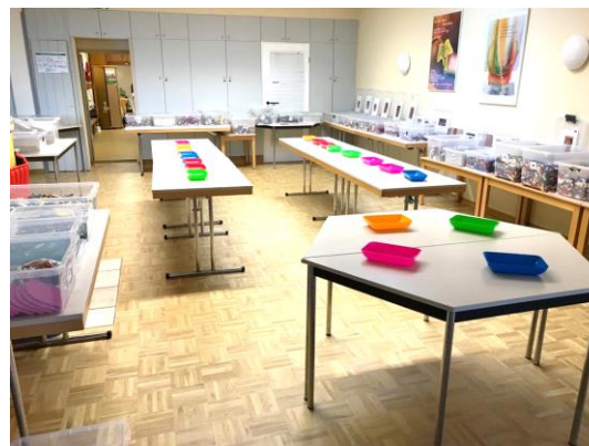
Baubereich mit gut zugänglichen Baukasten