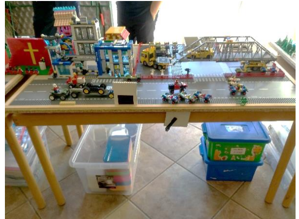
Aufbau der Holzplatten: links am Boden – rechts auf Tischen