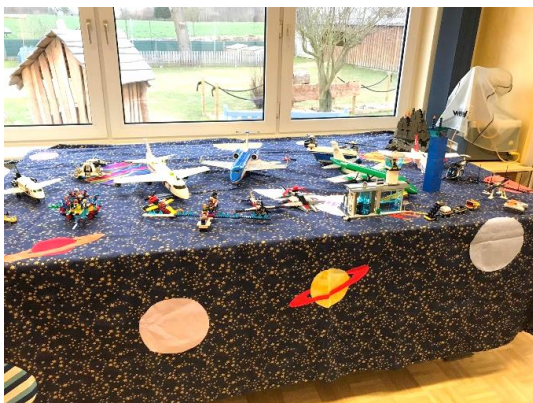
Die Flugzeuge und Raumschiffe auf einem Extratisch mit dem Sternenvorhang.