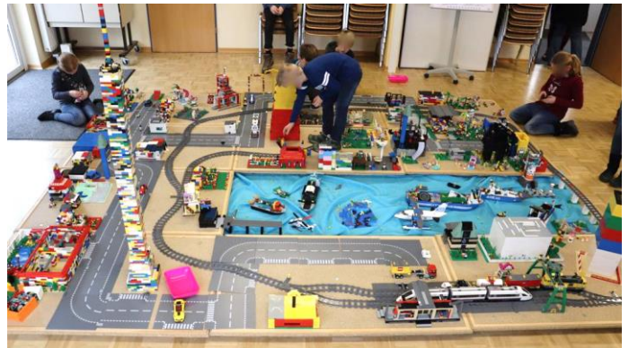
Aufbau der Eisenbahn: Links separiert auf 2 Tischen und erhöhten Holzplatten, rechts zwischen und auf den Holzplatten, die auf dem Boden liegen.